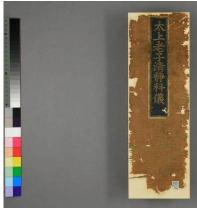
圖 1 清康熙年刊本《太上老子清靜科儀》

流傳既廣，環繞《清靜經》的科儀亦應運而生。如清康熙二十三年（1684）刊本《太上老子清靜科儀》，即專為講演《清靜經》、以解厄消災而設；中國四川、重慶、貴州等地區的民間道教有「靈寶五品經會」系列科儀，以念誦《度人經》、《生神經》、《清靜經》、《生天經》、《救苦經》五品為主而行度亡之事，其中《開演清靜經科》、《老君清淨（靜）法懺》等儀書，至今尚有大量抄本存世。下列三種科儀書影，足見《清靜經》在民間信仰與齋醮實踐中的活態流傳。